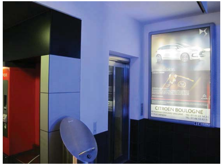
Parking Parchamp Caisses de Paiement