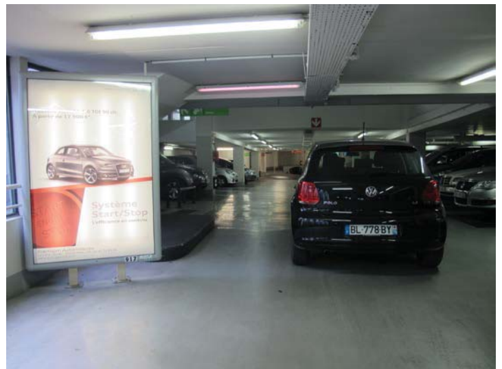
Parking Hôtel de Ville Entrée Auto