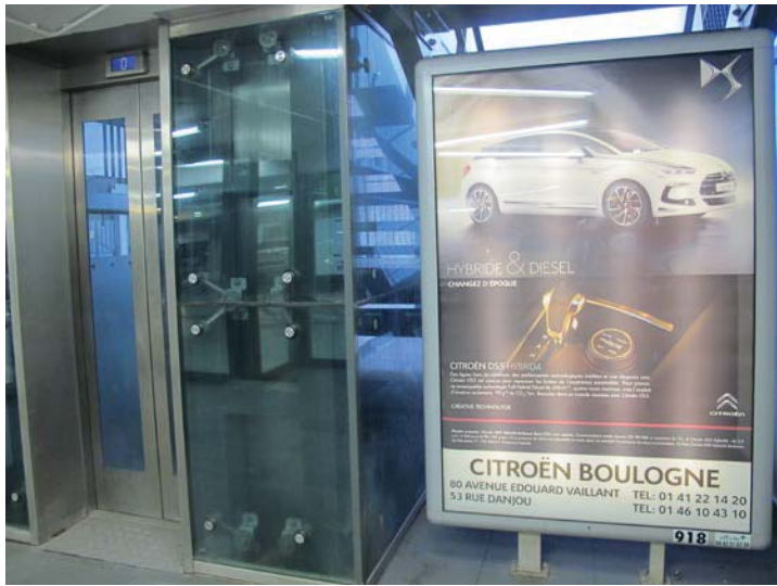
Parking Hôtel de Ville Caisses de Paiement