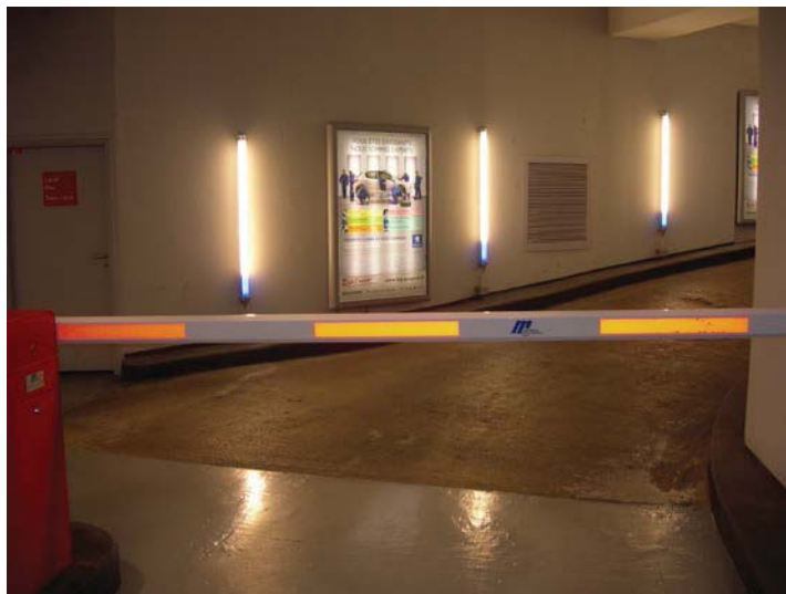
Parking Parchamp Sortie Auto